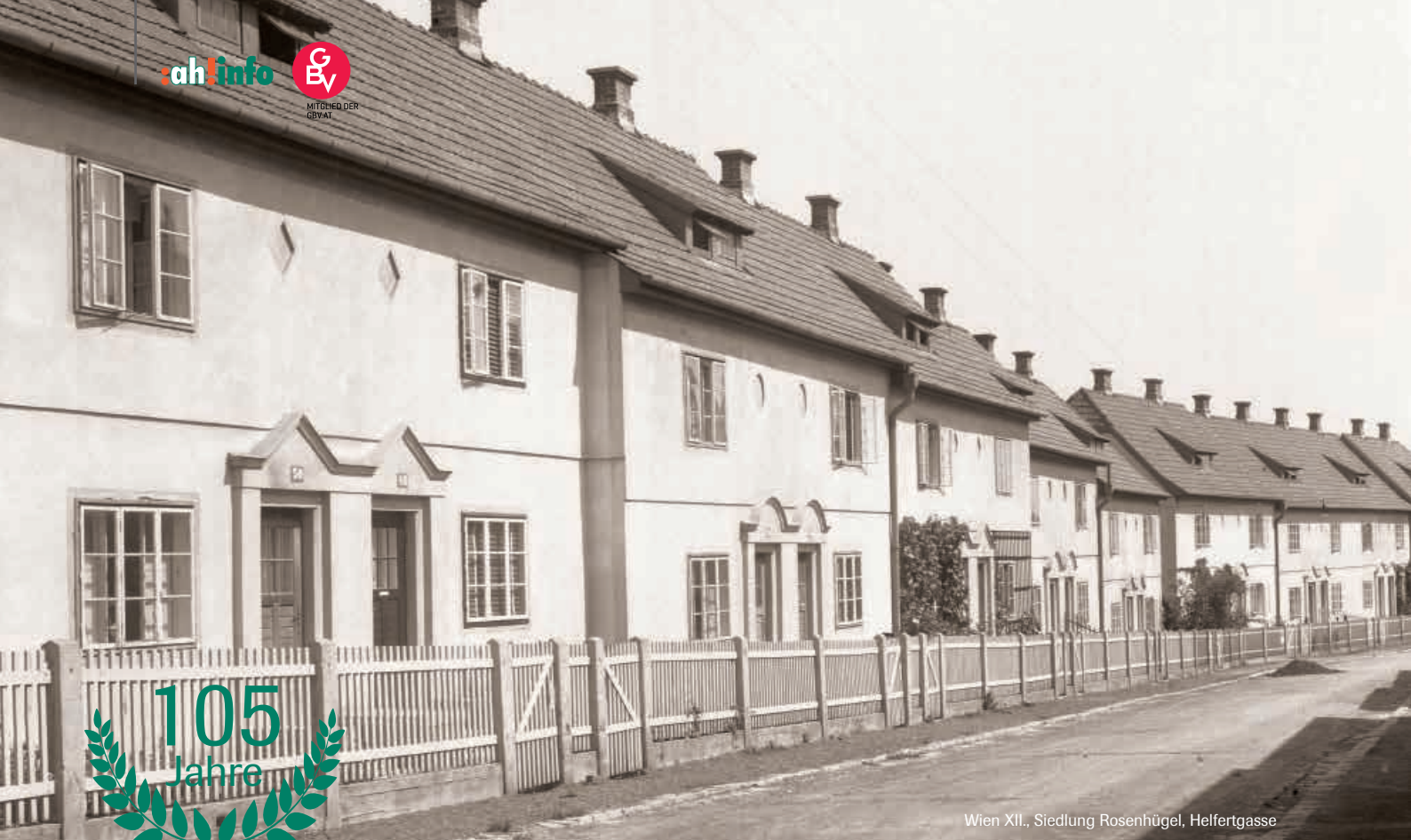
Wien XII., Siedlung Rosenhügel, Helfertgasse