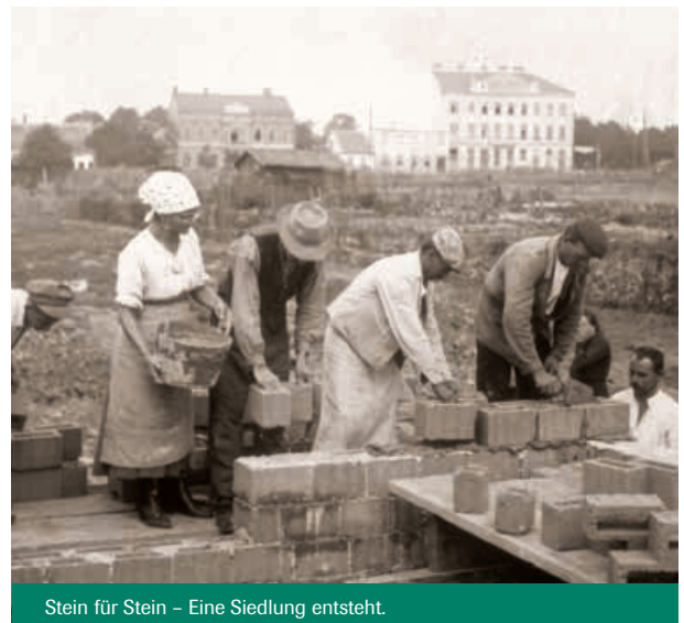
Stein für Stein – Eine Siedlung entsteht.

Besonders erfreulich ist, dass unsere Gemeinschaft nach wie vor stark von ehrenamtlicher Tätigkeit geprägt ist. Es wird zwar immer schwieriger neue Ehrenamtliche zu gewinnen, wir sind aber zuversichtlich und arbeiten daran, diese wertvolle Tradition fortzuführen. ■